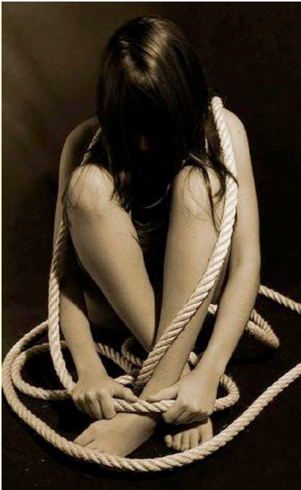
"Emakumea bere bakardadean...eta beste gauza batzuk". Kafe Antzokia